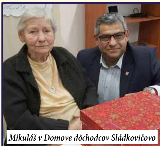
Mikuláš v Domove dôchodcov Sládkovičovo

Rôznorodé informácie, nedôvera a neistota ovplyvnila a rozdelila celú spoločnosť. Zatiaľ čo jedni dodržiavali všetky nariadenia a boli