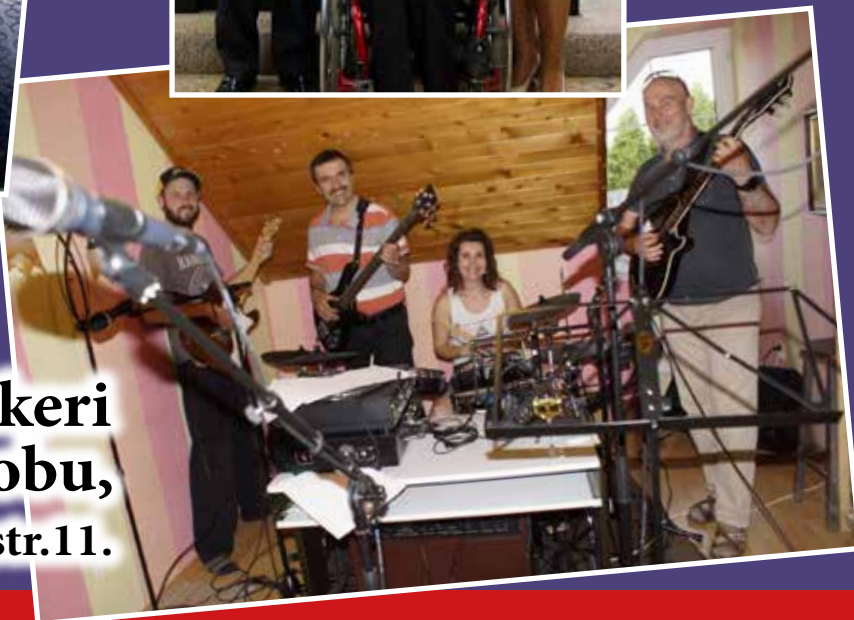
Rockeri z Veľkého Grobu, str.11.