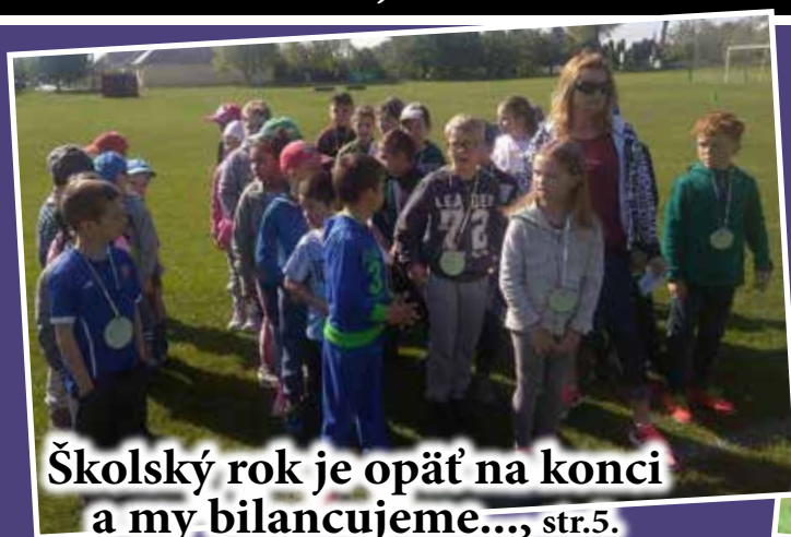
Školský rok je opäť na konci a my bilancujeme..., str.5.