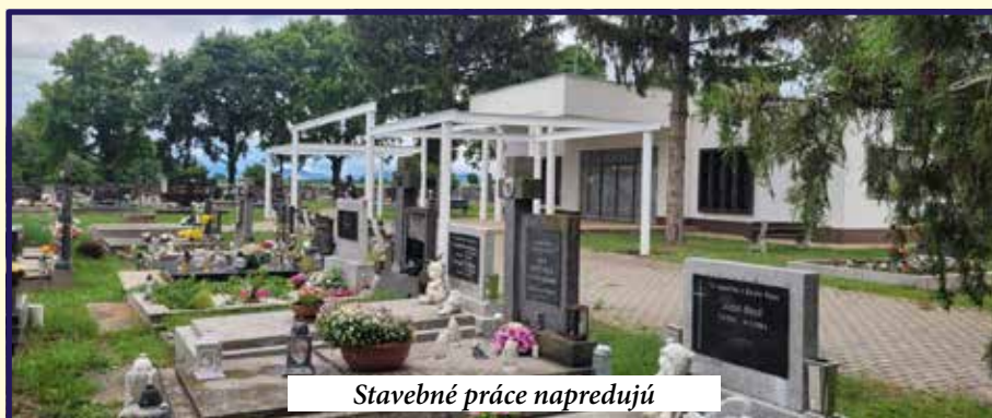
Stavebné práce napredujú