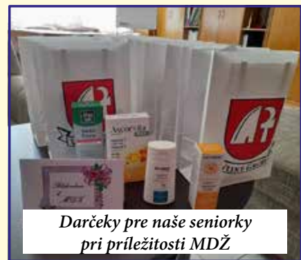
Darčeky pre naše seniorky pri príležitosti MDŽ

vované miesto sa ošetrí vysokoteplotnou penetráciou, ktorá obnovuje elasticke vlastnosti asfaltových povrchov. Potom sa celé opravované miesto zasype drvenou asfaltovou zmesou a po nahriatí zhutní vibračnou doskou. Opravy výtlkov s týmto zariadením stoja obec zlomok ceny v porovnaní s tým, čo