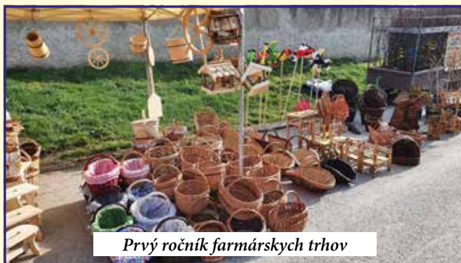
Prvý ročník farmárskych trhov

infražiarica je považovaná za najlepšiu a najefektívnejšiu pri oprave miestnych komunikácií. Spočíva v tom, že zahreje asfalt na vysokú teplotu, približne 160 °C a opra-