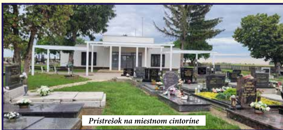
Prístrešok na miestnom cintoríne