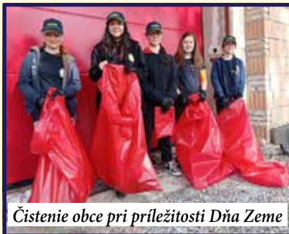
Čistenie obce pri príležitosti Dňa Zeme

V najbližších dňoch by sa konečne mali obnoviť aj stavebné práce na moste cez Vištucký potok. Už vidím, ako vám táto veta vyčarila úsmev na tvári, v zmysle: „To sme už počuli a stále sa nič nedeje.“ Popravde, máte čiastočnú pravdu. Z oficiálneho mailu citujem: „Odovzdanie a prevzatie stavby 20. 6. 2022. Ukončenie stavby do 120 dní odo dňa odovzdania staveniska.“ Toto je skutočnosť prezentovaná Správou ciest v tejto chvíli,