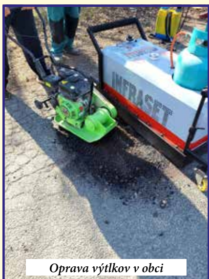
Oprava výtlkov v obci

Milí spoluobčania, aj v našej obci sme vypadli z koloritu všedných dní a sviatočných príležitostí. To, čo nám je milé, sme museli odložiť na neurčito. My sa však nevzdávame. Aj keď sa nám už druhý rok do tradičných stretnutí pri príležitosti Medzinárodného dňa žien vmiešala pandémia a tradičné posedenie s vystúpením detí z materskej a základnej školy sa neuskutočnilo, neznamenalo to, že sme na naše ženy zabudli. Prípomenuli