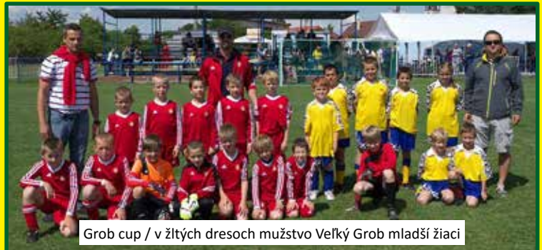
Grob cup / v žltých dresoch mužstvo Veľký Grob mladší žiaci