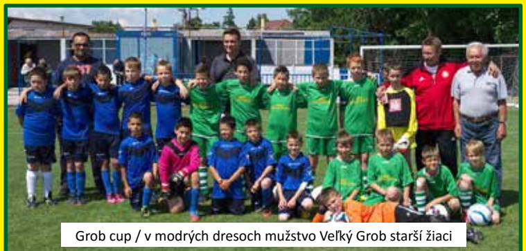
Grob cup / v modrých dresoch mužstvo Veľký Grob starší žiaci