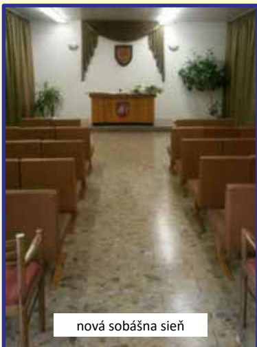
nová sobášna sieň

Priestory na obecnom úrade sú stiesnené a nevyhovujúce danému účelu, preto nás napadlo zriadiť sobášnu sieň v kultúrnom dome. Podarilo sa tu vytvoriť novú, krásnu miestnosť na dôstojné vykonávanie sobášnych obradov, ktorá už naplno slúži svojmu účelu. Aj zdravotné stredisko sa teší novému vzhľadu.