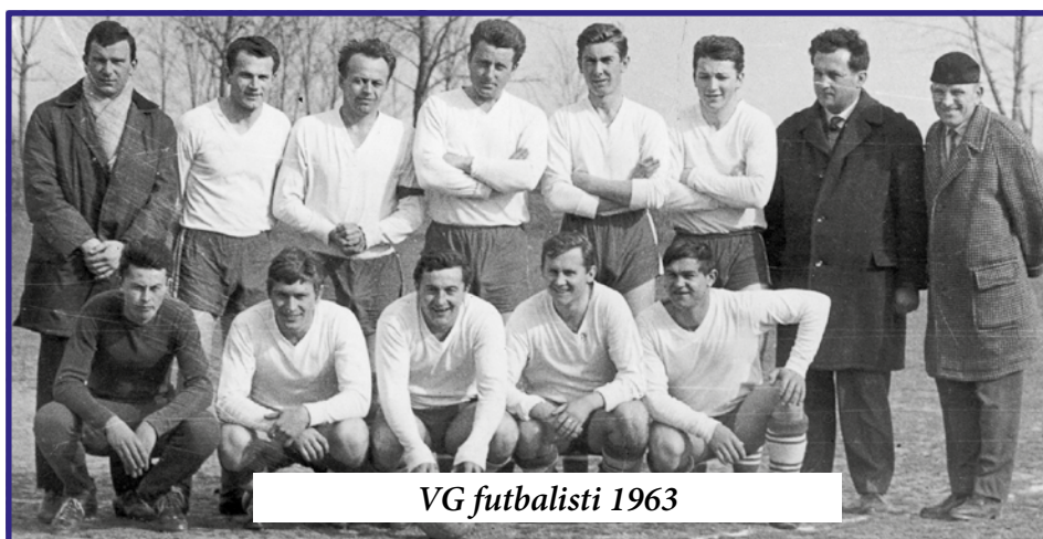
VG futbalisti 1963