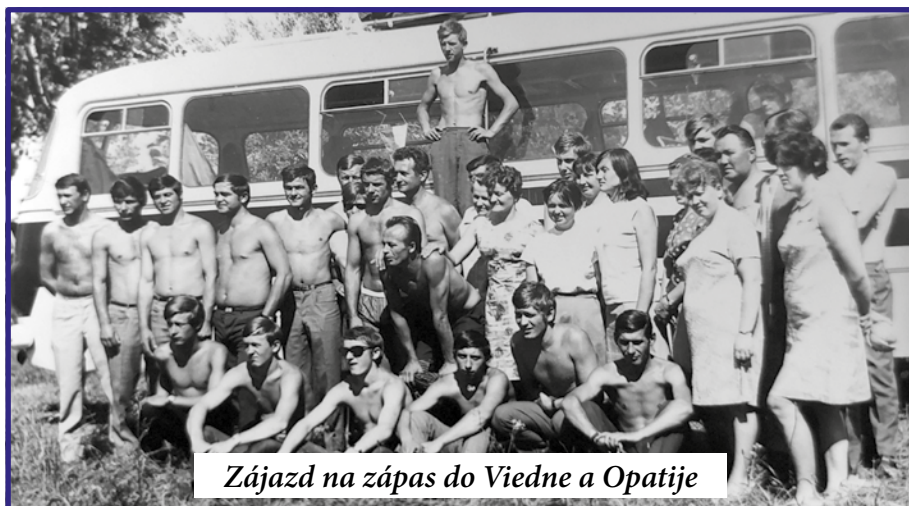
Zájazd na zápas do Viedne a Opatije