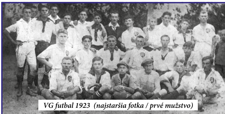
VG futbal 1923 (najstaršia fotka / prvé mužstvo)