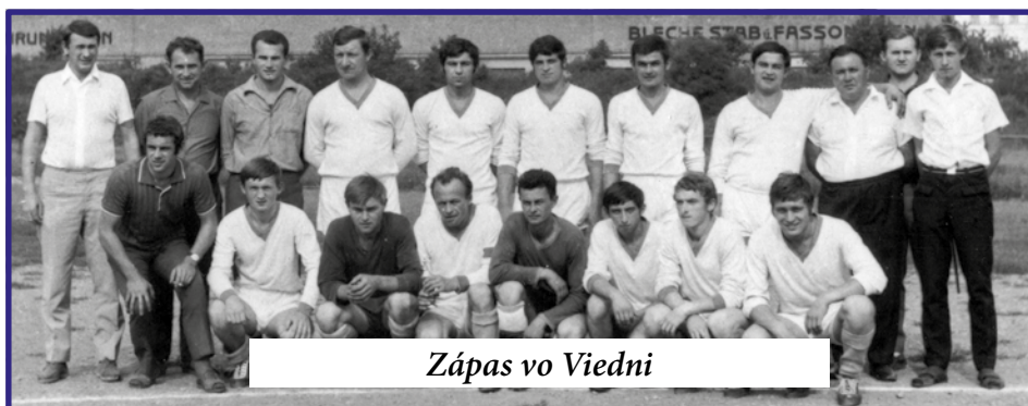
Zápas vo Viedni