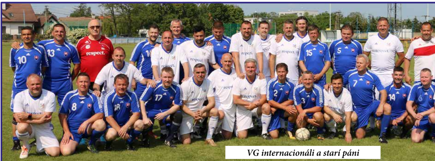
VG internacionáli a starí páni