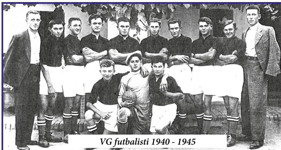
VG futbalisti 1940 - 1945